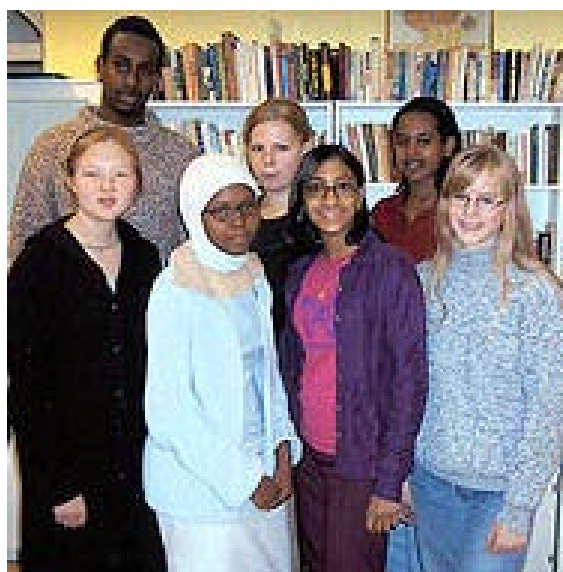
Schüler aus Hjulstaskolan